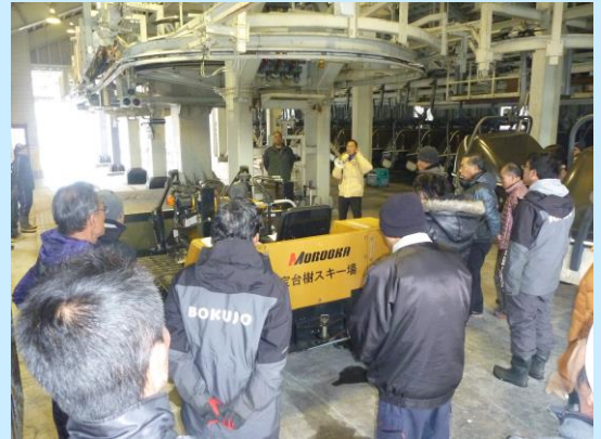
安全教育講習風景(技能向上)

また、シーズン営業中も定期的の実務研修等を実施し、安全輸送に対する意識の保持に努めています。更に、索道従事者を専門機関主催の各種研修会等へ参加させています。